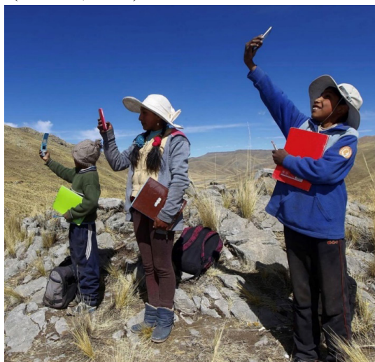
Figura 2 Estudiantes de la comunidad de Conaviri (Mañazo, Puno)

terio de Educación (Figura 2). Este tipo de historias no son casos aislados. De hecho, “en el primer trimestre de este año, el 40,1% de los hogares del país contó con conexión a Internet” (INEI, 2020).