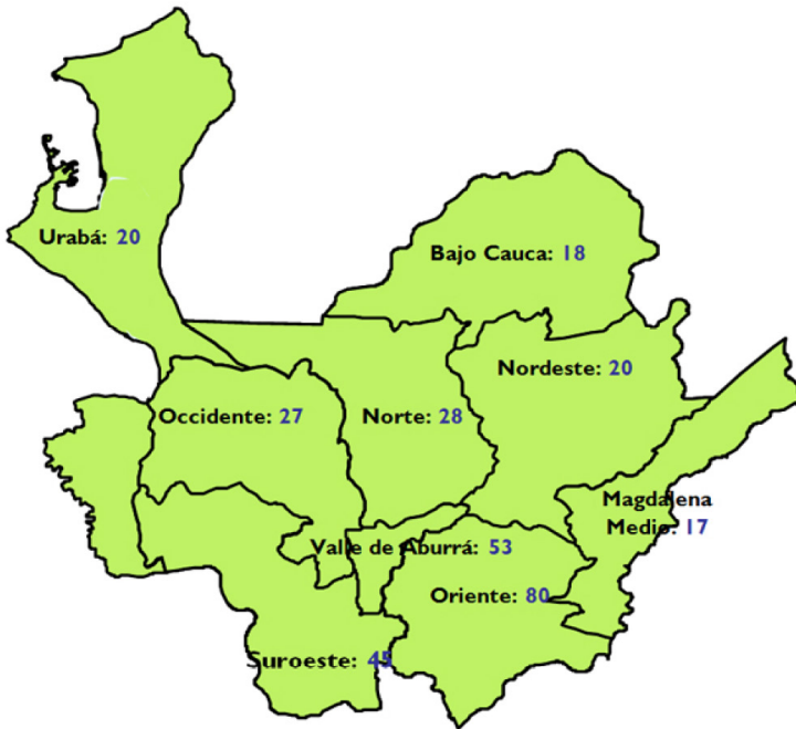
Figura 2 Medios alternativos en Antioquia, Colombia - 2005