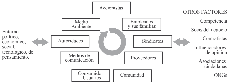
Figura 3: Radio de acción de los multistakeholders .