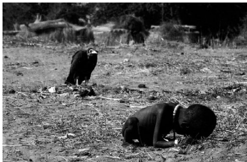
Figura 3: “El niño y el buitre en Ayod” (1993).