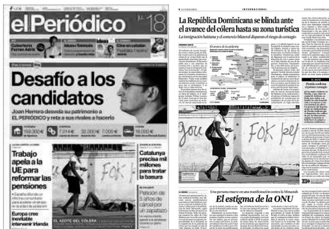
Figuras 13 y 14: Portada de El Periódico y página de “Internacional” de La Vanguardia (2010).