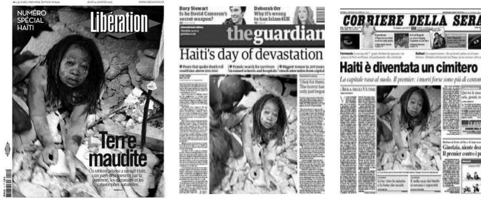
Figura 11: Ejemplo de “portada global” sobre terremoto en Haití (2010).