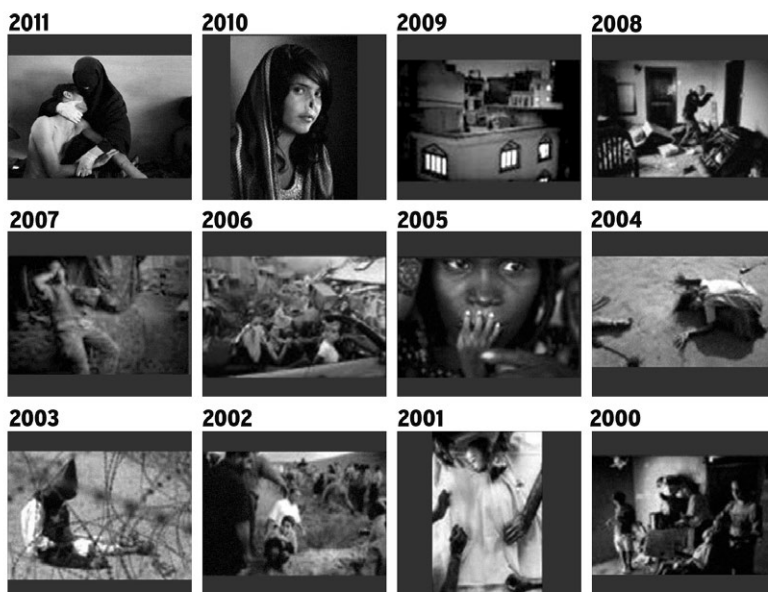
Figura 9: Fotos ganadoras del World Press Photo 2000-2011.