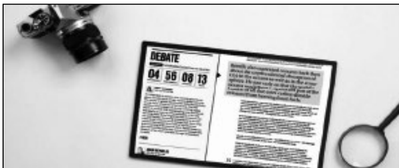
Figura 4: Fotogramas del video “El futuro del libro IDEO”.

IDEO cree que el constante crecimiento del contexto digital puede mejorar nuestra noción de los libros. Con base en este enunciado proponen tres conceptos de experiencia lectora desarrollados por ellos en los que explican de qué forma se puede dar esta integración entre contexto digital y noción de libro.