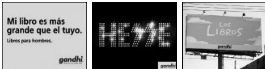
Figura 2: Publicidad gráfica de librería Gandhi.

Esta librería ha utilizado un recurso creativo y divertido para atraer a diferentes grupos hacia la lectura tradicional 1 , empleando afiches, carteles y publicidad BTL (figura 2) con frases ocurrentes tales como “Mi libro es más grande que el tuyo. Libros para hombres”, “Leer, guey, aumenta, guey, tu vocabulario, guey”, “Enamorados se suicidan por falta de comunicación [Ya leíste Romeo y Julieta]”, entre otros: