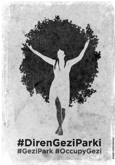
Figura 4: Poster Diren Gize Parki.